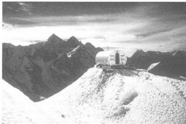
Silver Hut

Základní tábor expedice byl zřízen u vesnice Mingbo ve výšce 4 660 m. Vlastní obytná laboratoř, chata, dle Hillaryho ve tvaru obrovské odvodňovací roury (20), dle Milledge (32) tvaru vagonu londýnského metra, o velikosti 7krát 3 m, byla smontována z překližkových dílů vyrobených v Anglii, nabarvených stříbrnou barvou a vyplněných izolační pěnou. Byla postavena ve výšce 5 790 m na ledovci Mingbo (obr.). Odtud „ Silver Hut “ (Stříbrná chata), která měla osm paland. O 370 m níže byla postavena dřevěná chata se čtyřmi palandami, jejíž střechem i stěny pokrývala zelená plachta, proto pojmenování Green Hut (48). V této výšce, z hlediska výškové fyziologie v „šedé zóně“ mezi aklimatizací a deteriorací, je parciální tlak kyslíku ve vzduchu poloviční, poloviční byla i pracovní kapacita, která se v průběhu pobytu přiblížila ke dvěma třetinám výchozích nížinných hodnot. Kyslíková saturace (SaO 2 ) byla 70 % a v zátěži klesala pod 50 %, i přes mimořádně vysoké hodnoty plicní ventilace (32).