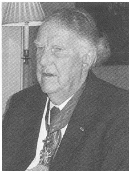
Edmund Hillary 23. června 2004 ve Varšavě