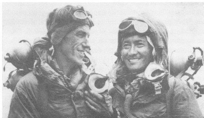
Hillary a Tenzing v roce 1953